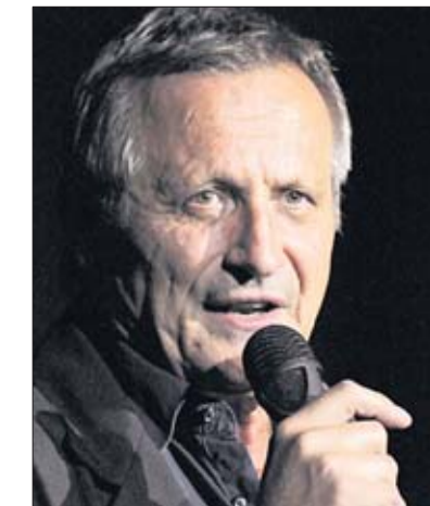
Der Liedermacher Konstantin Wecker.

Mit seinem aktuellen Programm „Leben im Leben“ kommt der Künstler am Mittwoch, 23. September, ins Stadeum. Von 19.45 Uhr an trägt er alte und neue Kompositionen vor. Der Vorverkauf hat bereits begonnen. Die Karten kosten zwischen 23,50 Euro und 40 Euro. Wer Wecker live erleben möchte, kann sich seine Eintrittskarte unter der Rufnummer 04141/40 91 40 oder direkt beim Stadeum sichern. (fre)